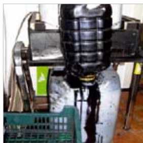
Sprzęt produkcyjny skonfiskowany od fałszerza w Krakowie

Ostatni sukces jest świadectwem długotrwałej i wartościowej współpracy pomiędzy programem HP ACF i polskimi władzami. Podjęte czynności, poza samą konfiskatą, zapobiegły produkcji jeszcze większej ilości podrobionych wkładów drukujących w przyszłości. Ponadto umożliwiono wprowadzenie podrobionych produktów na rynki poza granicami Polski, które także były celem fałszerzy.